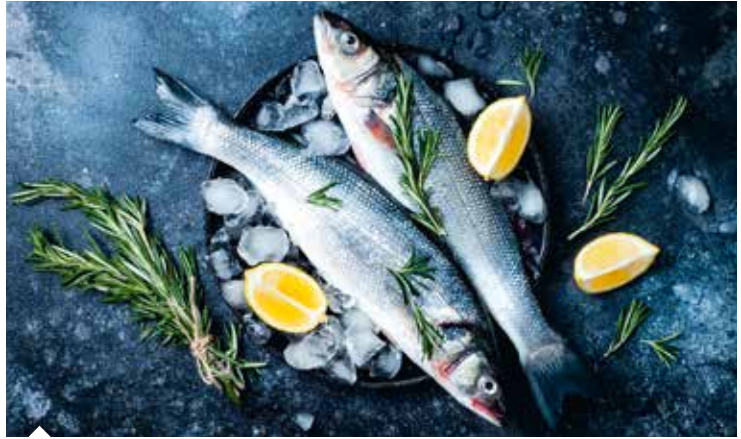
Levrek yetiştiriciliğinde dünya birincisi bulunan Türkiye, bu lezzetli balığın ihracatından geçen yıl 355,6 milyon dolar döviz kazandı.

suda yaşayan diğer omurgasız hayvanlar kategorilerinde yer alan su ürünlerinde Türkiye'nin ihracatı son 5 yılda yüzde 35 arttı. 2016'da 744,6 milyon dolar döviz kazandıran su ürünleri sektörü, bu rakamı 2017'de 797,3 milyon dolara, 2018'de 879,6 milyon dolara, 2020 yılında 1 milyar 53 milyon dolara çıkardı. Söz konusu beş yıllık dönemde toplam su ürünleri ihracatı 4 milyar 392 milyon dolar oldu.