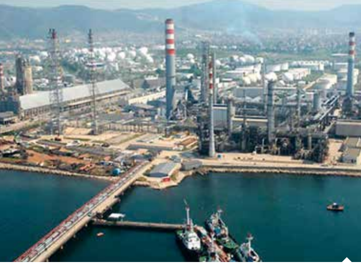
İSO 500'de İskenderun Demir Çelik A.Ş. 16 milyar 909 milyon TL ile 10'uncu oldu.

tedarik zincirinde kopmalara neden oldu. Bu zorlu yılda 11 milyar 206 milyon dolarlık ihracata imza atan Birliğimizin, İstanbul Sanayi Odası'nın (İSO) hazırladığı Türkiye'nin 500 Büyük Sanayi Kuruluşu 2020 Araştırmasında 54 üye ile temsil edilmesi bizlere büyük gurur ve mutluluk yaşatıyor. Sanayi devleri arasına adını yazdıran tüm üyelerimizi ve çalışanlarını canı gönülden tebrik ediyoruz. Katma değeri yüksek tarımsal üretimin yanında tasarım üstünlüğüne sahip teknoloji yoğun sanayi ürünlerinde de söz sahibi olan Akdeniz Bölgesi'nin üretim gücünü dünya genelinde 215 ülke ve özerk bölgeye yansıtan üyelerimizin Covid-19 virüsünün aşılama ile ortadan kaldırılmasıyla birlikte hem üretimde, hem de ihracatta daha iyi noktalara geleceğine inanıyoruz."