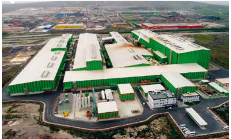
İSO 500'de Tosçelik Profil ve Sac Endüstri A.Ş. 10 milyar 225 TL ile 16'ncı sıraya yerleşti.

Mersin'in ilk ve tek ihtisas organize sanayi bölgesi unvanını taşıyan Mersin-Tarsus Tarımsal Ürün İşleme İhtisas Organize Sanayi Bölgesi'nde tarımsal ürün işleme ve gıda sektöründe faaliyet gösteren 100 fabrikanın yıllık 250 milyon dolar ihracat gerçekleştirilmesi hedefleniyor. Yeni kurulan Tarsus Organize Sanayi Bölgesi de yatırımcılar için cazibe merkezi oldu. Kayserili sanayicilerimiz Birleşik Arap Emirlikleri'nin Dubai kentinde oluşturulan Kayseri OSB Dubai Türkiye Ticaret Merkezi'ni faaliyete geçirdi. 3 milyar dolarlık pazar hacmine sahip olan bu bölgede Kayseri'de üretilen sanayi ürünlerinin tanıtımı ve pazarlaması daha etkin şekilde yapılacak. Mobilya sektörünün en büyük firmalarının kümelendiği Kayseri ilimizde süngerin ham maddesi olan Poliöl'ün yerli imkânlarla üretilmesi için kentteki sanayiciler güç birliği oluşturdu. Bu projeye 1 milyar dolarlık ithalatın ikame edilmesi hedefleniyor. Sözü ettiğimiz bu yatırımlar, bölgemiz ve ülkemiz ekonomisine büyük canlılık getirecektir. Birçok sektörde yan sanayinin de gelişmesine imkan sağlayacak yeni yatırımlar, bölge ihracatımızda da büyük sıçramalar yapmamızın anahtarı olacaktır."